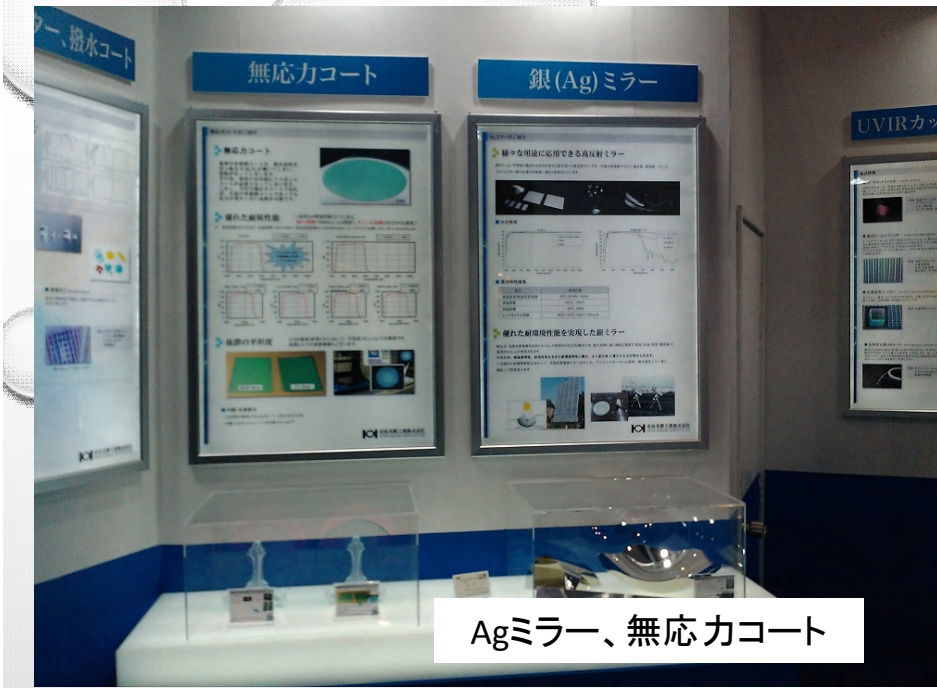
Agミラー、無応力コート