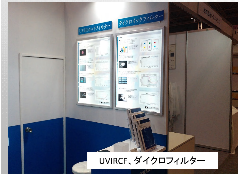
UVIRCF、ダイクロフィルター