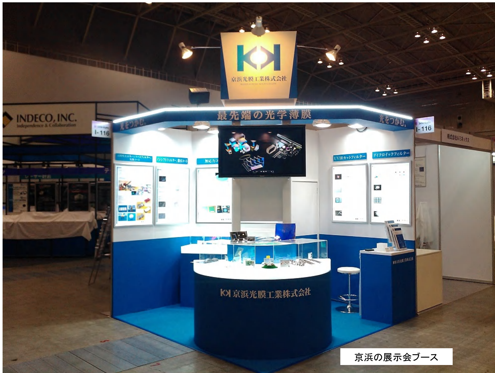
京浜の展示会ブース