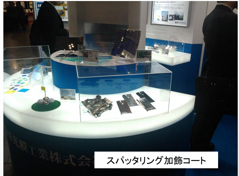
スパッタリング加飾コート