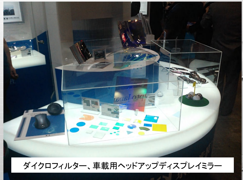
ダイクロフィルタ、車載用ヘッドアップディスプレイミラー