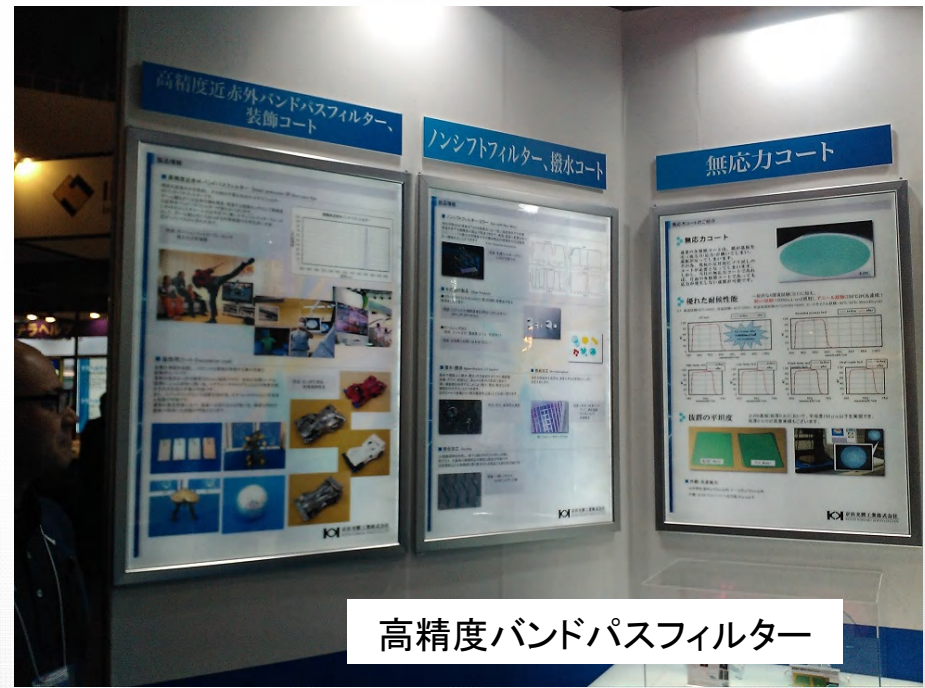
高精度バンドパスフィルター